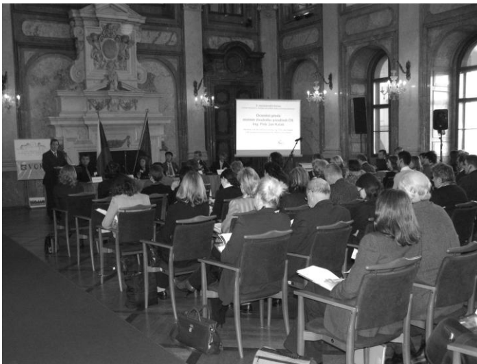
předání cen v Senátu ČR

Spolupráce všech partnerů na tomto projektu byla oceněna 3. místem v soutěži O lidech s lidmi, pořádané ve spolupráci Českých a Japonských pořadatelů. Ocenění je o to významnější, že projekt se umístil hned za projekty Kraje Vysočina a města Otrokovice mezi dalšími 17 účastníky. Získanou cenou je studijní pobyt v Japonsku pro manažerku sdružení SPLAV.