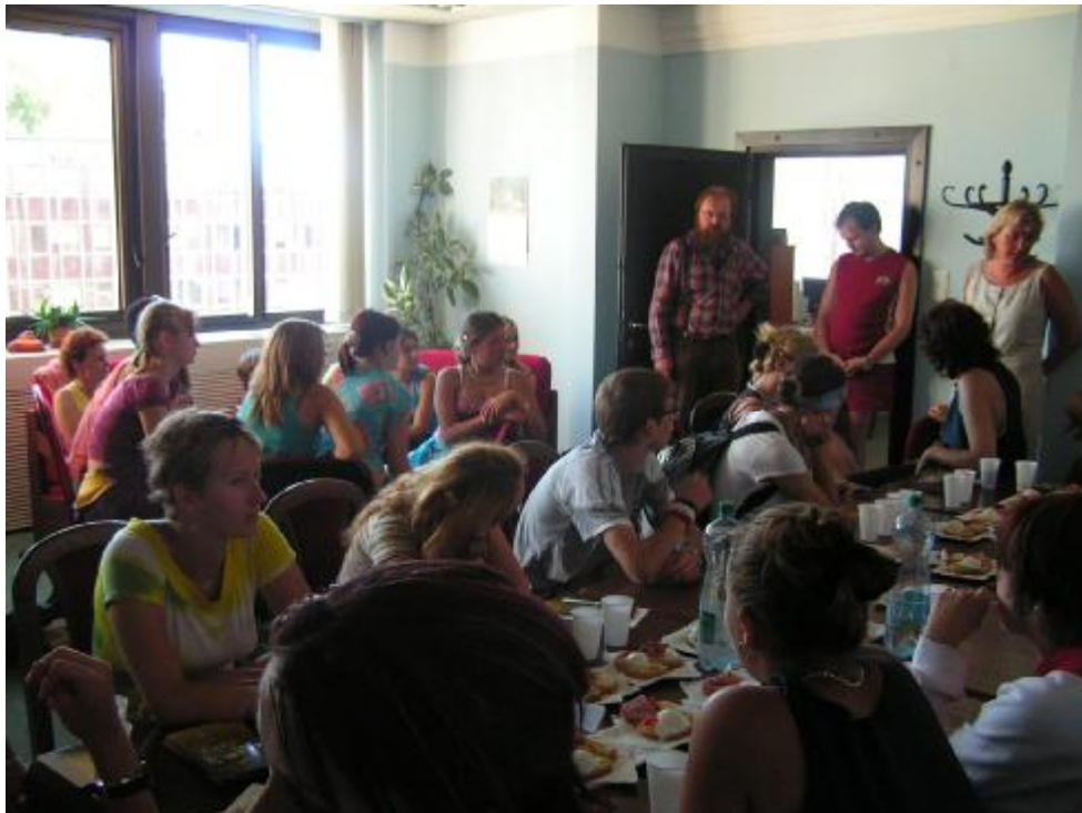
Beseda V Regionální rozvojové agentuře .

Na uspořádání tábora jsme nedostali grant Kraje, a tak jsme ho zaplatili sami. Chtěli jsme, aby se kromě nás, dospělých, setkali se zahraničními partnery naší MAS i naše děti a zajistili tak pokračování našich dobrých vztahů. Tábor se konal na základně sdružení Villa Nova v Uhřínově pod Deštnou. Z každé ze 4 zemí se zúčastnilo 8 dětí se 2 pedagogy. Program byl bohatý – pomoc v archeoskanzenu, procházky po horách, výlety po kraji, hry, společné vaření, besedy. Máme radost, že se tu všem líbilo natolik, že v roce 2007 bude mít projekt hned tři pokračování – tábor těch už skoro dospělých ve Francii, tábor mládeže pod Homolí v Borovnici a tábor nejmenších ve Skuhrově. Organizaci zajišťují partneři a členové MAS.