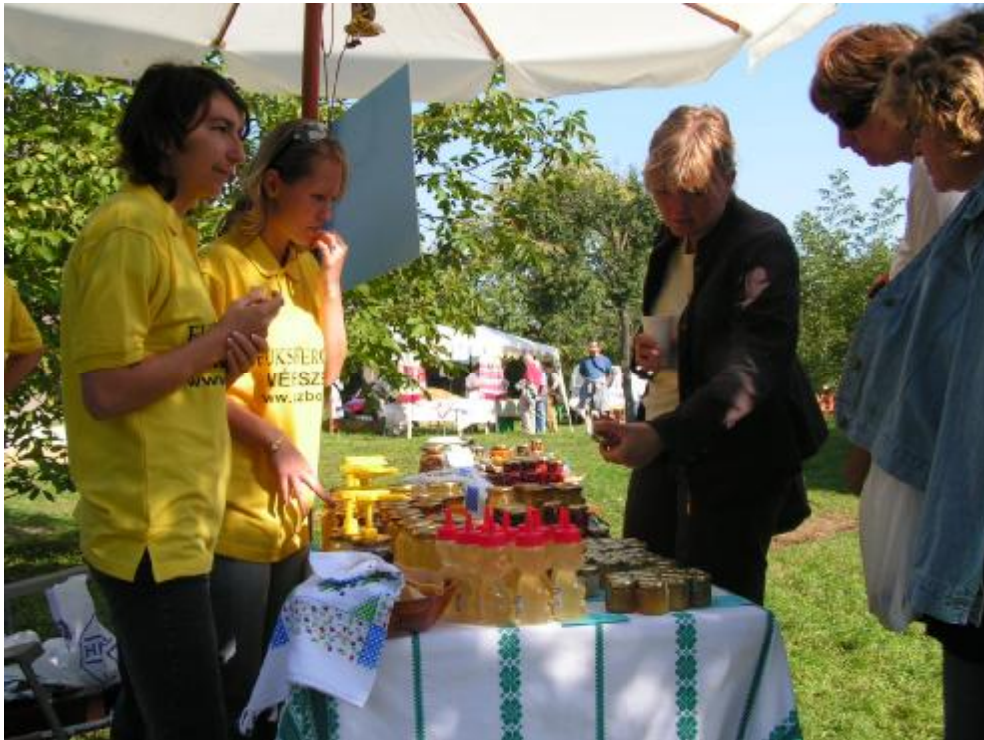
Trh místních výrobců Oszkó. 1