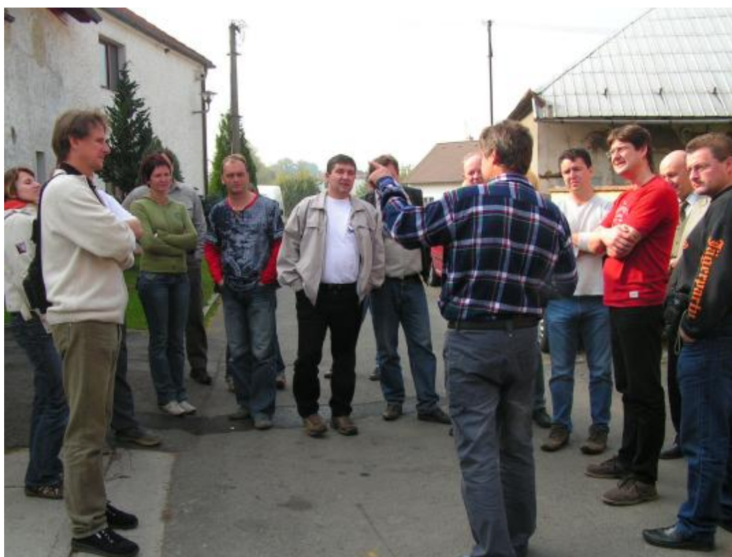
V pěstitelské pálenici.