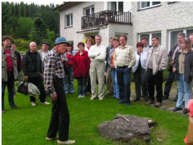
Začíná prohlídka skalky.