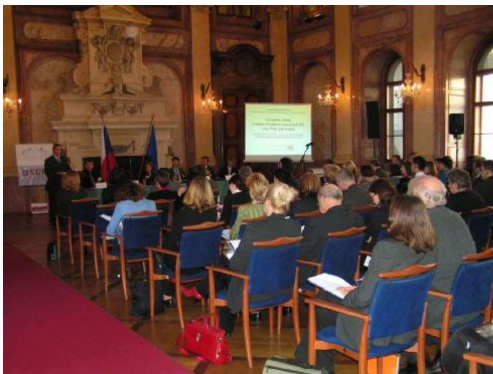
Předání cen v Senátu ČR.