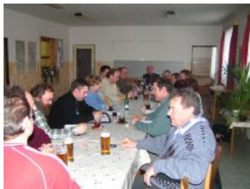
V solnické kuželně

16.1., 20.2., 27.3., 24.4., 22.5., 31.7., 28.8., 2.10., 18.12.