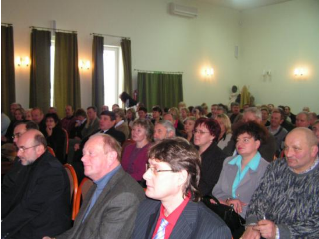
Na konferenci v Klodzku.