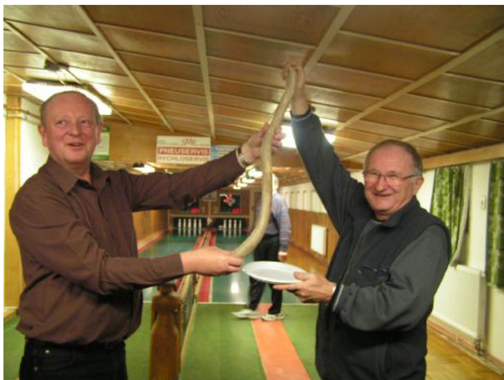
To je Kus!