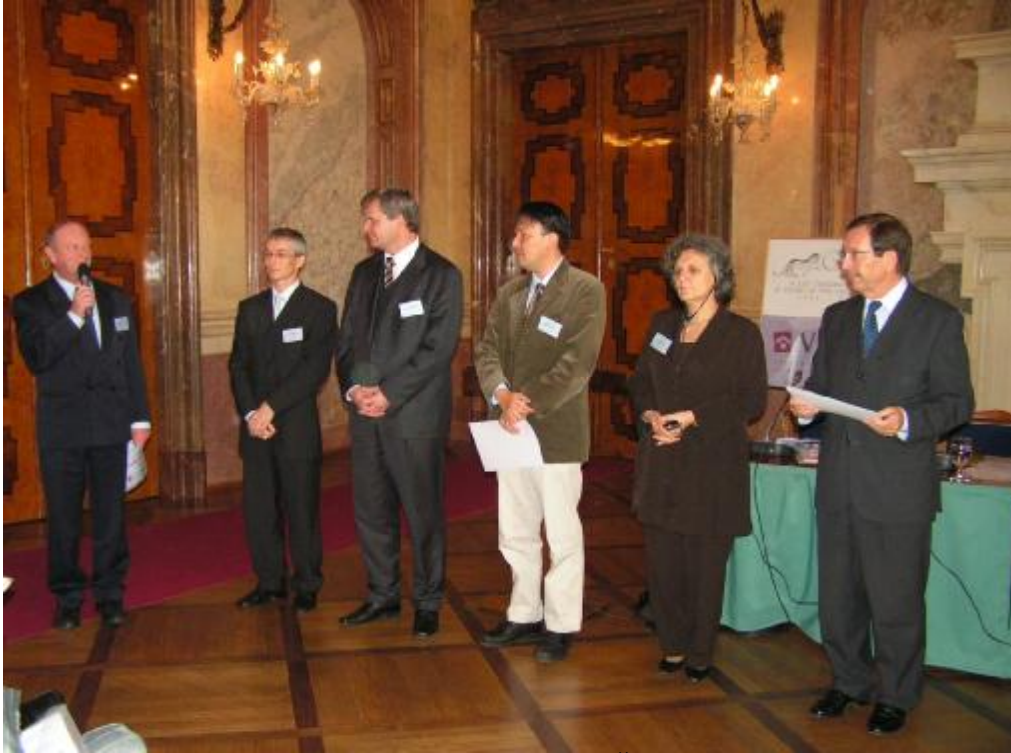
Předání cen v Senátu ČR.